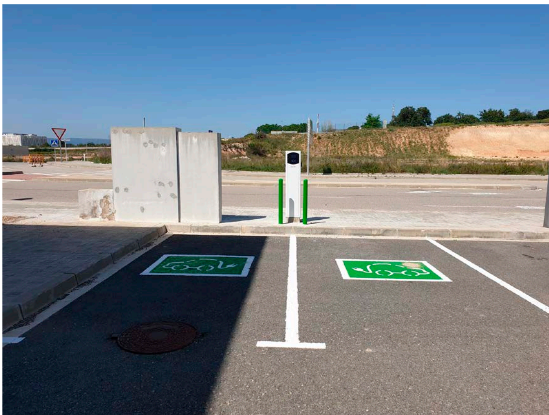
Punt de recàrrega a la CIM el Camp

CIMALSA en la seva contínua aposta per les noves fonts d'energia, té previst en una primera fase la inversió de més de 100.000 euros en la instal·lació de plaques fotovoltaïques a la CIM el Camp , destinada a l'autoconsum elèctric de l'edifici de control i en la instal·lació de punts de recàrrega per a vehicles elèctrics en l'aparcament de Castellar del Vallès , la CIM el Camp , CIM Vallès i CIM la Selva .